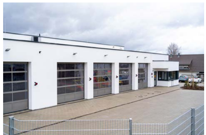
Vom Land Baden-Württemberg geförderte Rettungswache Langenau; Fotografie: Martin Rösch.

Die Mittel werden den Regierungspräsidien jährlich vom Ministerium des Inneren, für Digitalisierung und Kommunen Baden-Württemberg zugewiesen. Die aktuelle Mittelzuweisung umfasst die zu vergebenden Mittel für das laufende Haushaltsjahr sowie die Verpflichtungsermächtigungen für die Jahre 2023, 2024 und 2025.