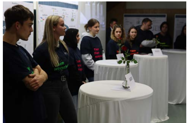
Die vier Schülerteams standen kompetent und auf Augenhöhe Rede und Antwort

Anschließend hatten Eltern sowie Schülerinnen und Schüler die Möglichkeit, sich auf dem „Markt der Informationen“ bei den Lehrkräften der Schule genauer über die einzelnen Fächer zu informieren. Eine weitere Informationsmöglichkeit vor Ort, auch zu den anderen Schularten des BSZ, bietet sich am Infotag Anfang Februar.