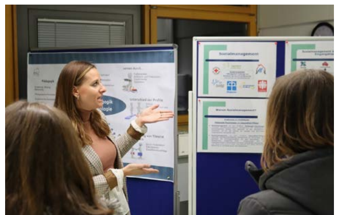
Von besonderem Interesse waren auf dem Markt der Informationen die berufsbezogenen Fächer