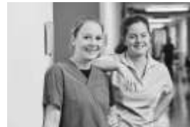
Auszubildende zur Pflegefachfrau im Zollernalb Klinikum

Weitere Infos unter www.zollernalb-klinikum.de , Bewerbungen bitte an karriere@zollernalb-klinikum.de