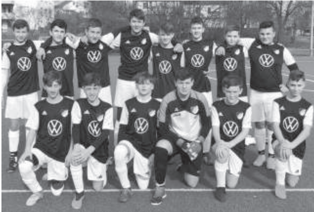
SV Rangendingen in neuem Trikot-Outfit