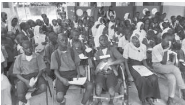
Kinder in ihrer Schüleruniform