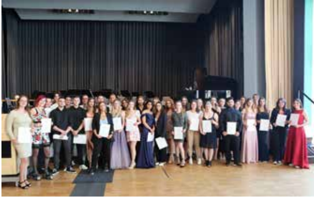
Die Absolventinnen und Absolventen mit Preisen und Belobigungen des 2022-er BK-Jahrgangs