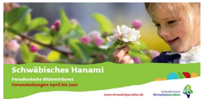
Titel: Paradiesische Blüenträume – Veranstaltungen April bis Juni

Damit keinem die „paradiesischen Blüenträume“ entgehen, startet der Verein Schwäbisches Streuobstparadies e.V. ab Mitte März wieder seinen beliebten Blüten-Ticker. Auf der Internetseite und unter dem Instagram Account www.instagram.com/streuobstparadies wird es tagesaktuelle Fotos von Apfel-, Kirschen- und Birnenknospen sowie -blüten zu bewundern geben. So sieht man auf einen Blick wo es schon blüht im im Streuobstparadies und wann sich ein Spaziergang durch den Traum in Weiß und Rosa besonders lohnt.