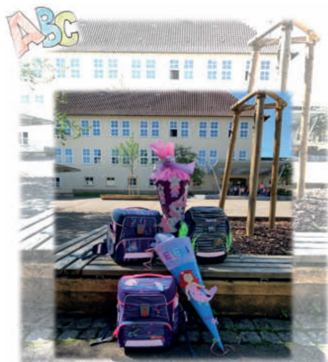
Alles Gute zum Schulanfang und viel Freude beim Lernen!